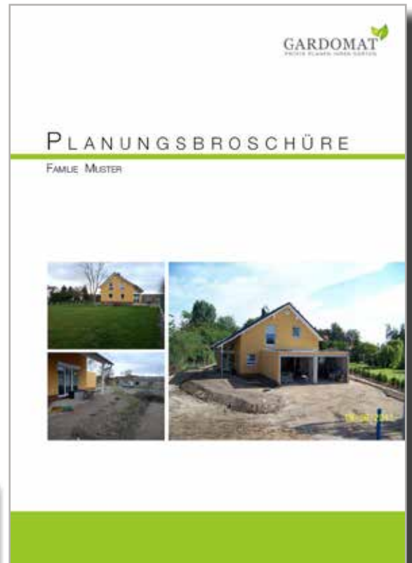
GARDOMAT-Planungsbroschüre; bei gardoPFLANZEN & gardoMATERIAL inklusive